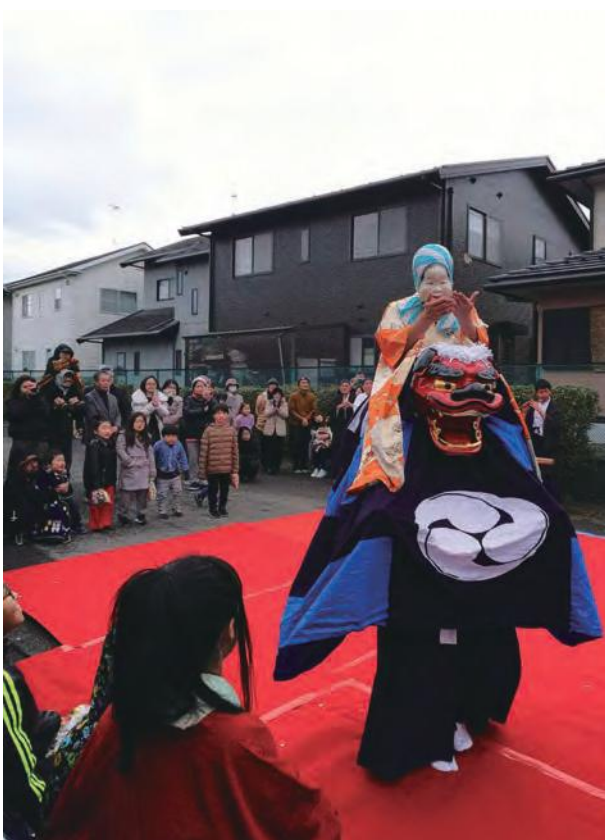
1/6 獅子舞 (小幡町)