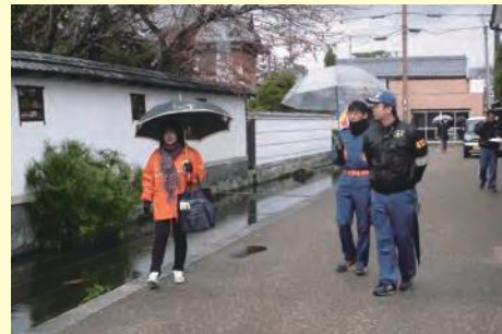
行方不明者に声かけする様子