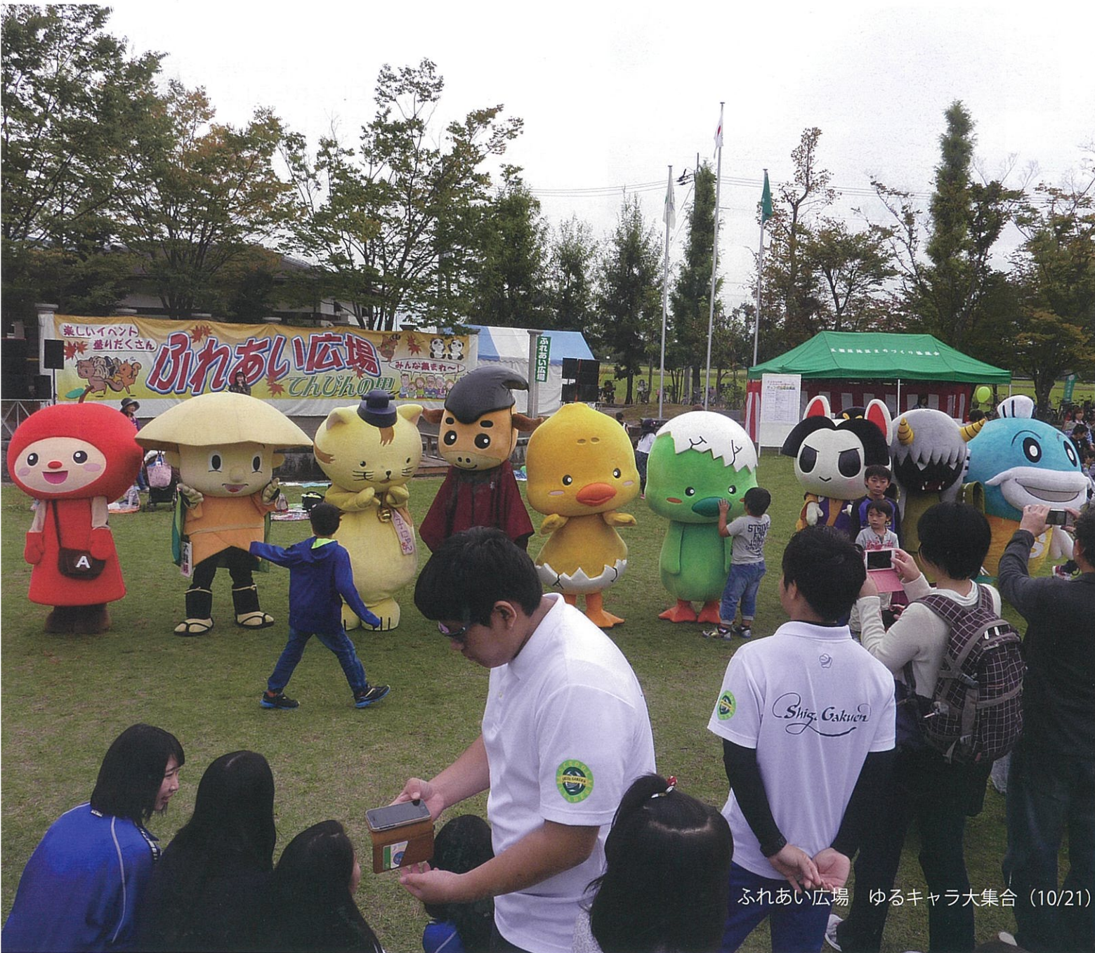
ふれあい広場 ゆるキャラ大集合 (10/21)