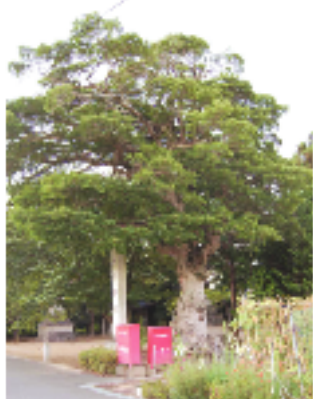
⑧ 塚本八幡神社のもちの木でんと座ったオヤジの風格