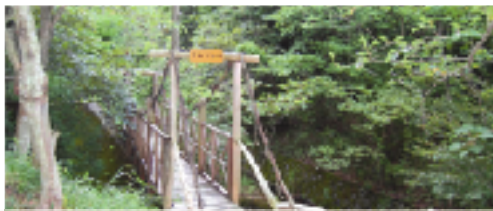
① 深谷散策道 川並愛郷の会が、織山麓に作られた散策道。つり橋や滝など景観に富んでいます