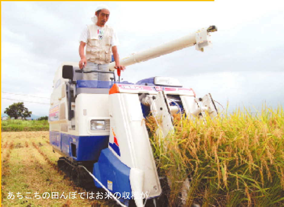
あちこちの田んぼではお米の収穫が

猛烈な夏の暑さが去って、爽やかな風が通りぬけていきます。 実りの秋、味覚の秋… 収穫の季節がやってきました。