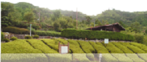
② 黎明の里 春の桜、秋の紅葉と眺望が素晴らしい

五個荘地区の西に位置する五個荘川並町と、隣接する五個荘塚本町は、織山を背にして、近江商人の旧宅が残る歴史ある美しい里です。山から受ける涼風を肌を感じながら、板塀の小道や街中を流れる水路にそって歩くと、あちらこちらに先人の足跡を観ることができます。