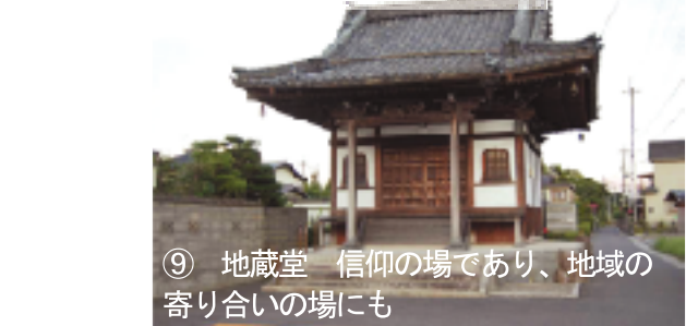
⑨ 地藏堂 信仰の場であり、地域の寄り合いの場にも