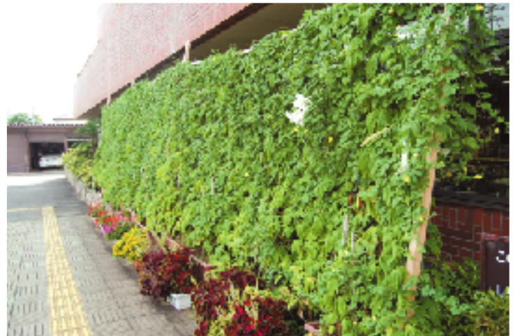
暑さを和らげてくれたゴーヤ（五個荘支所）