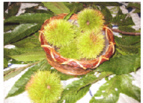
秋の味覚『栗』の出番ももうすぐ!