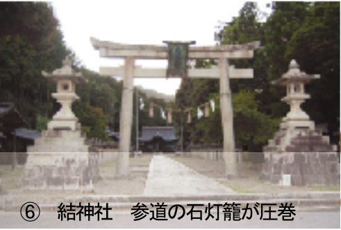
⑥ 結神社 参道の石灯籠が圧巻