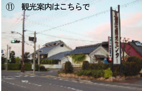
⑪ 観光案内はこちらで