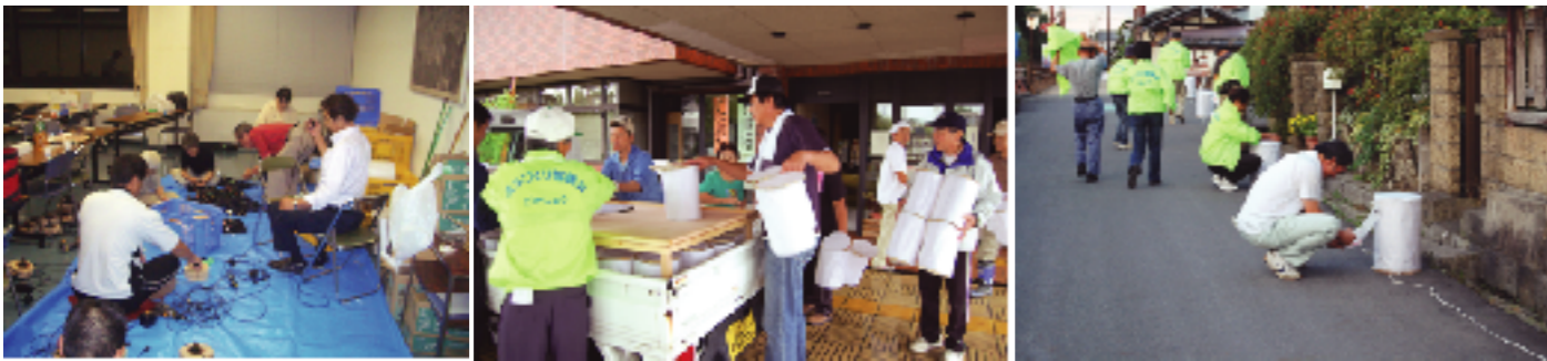
この日のために、多くのボランティアの協力をいただきました。