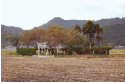
①野神さん 農耕を守護する神です。田園地帯の中にぼつねんと祀られています。

五個荘の北東部に位置し、国道8号線をまたいで拡がるまちは、昭和・平成と時を経て大きく街並みが変わってきました。それでも、まちの小路を歩くと、時代を生き抜いた建物や自然に出会うことができます。新しいものと旧き良きものが共存するまちです。