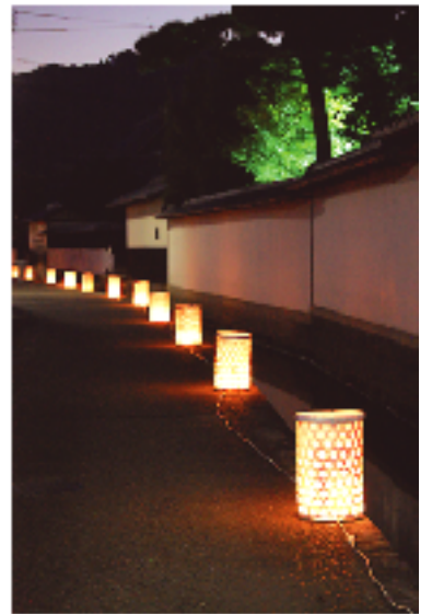
近江商人 街並み灯り路