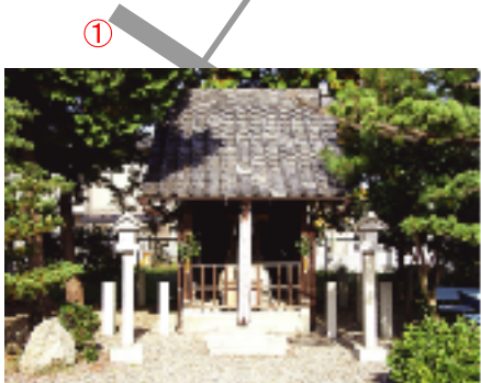
⑥白山神社 五穀豊穡の守り神