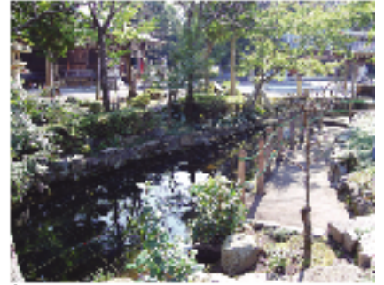
③五箇神社 庭園「五箇の園」は、この辺りでは珍しい神苑池