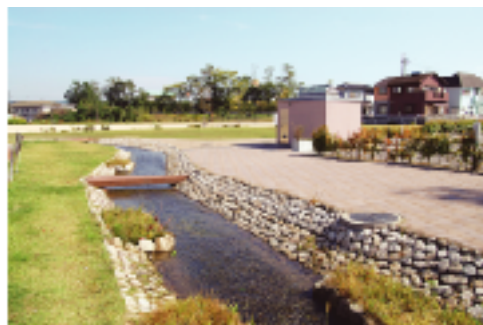
⑨北公園 親水公園として整備、地域の憩いの場となっています