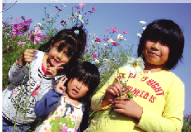
広告・我が家のアイドルを募集しています。