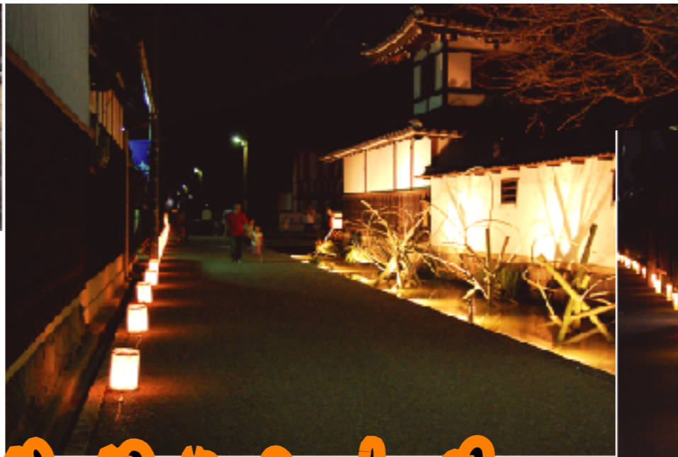
約1kmにわたる灯りの路 (金堂町～塚本町～川並町)

毎年、秋のお彼岸の時期、恒例となった『近江商人：街並み灯り路』ですが、今年は9月22日23日に開催しました。22日は、秋の夜長、夕食後に灯りを愉しむ家族連れなどで賑わいました。23日は『ぶらっと五個荘まちあるき』で五個荘の町は遠方からのお客様で大賑わいでしたが、日中の喧騒から一転して、夕暮れからは近江商人の街並みや水辺が行灯の淡い光で静かに照らし出されました。訪れてくださった方々は、昼間と違った風情を味わっていただけたのではないのでしょうか。