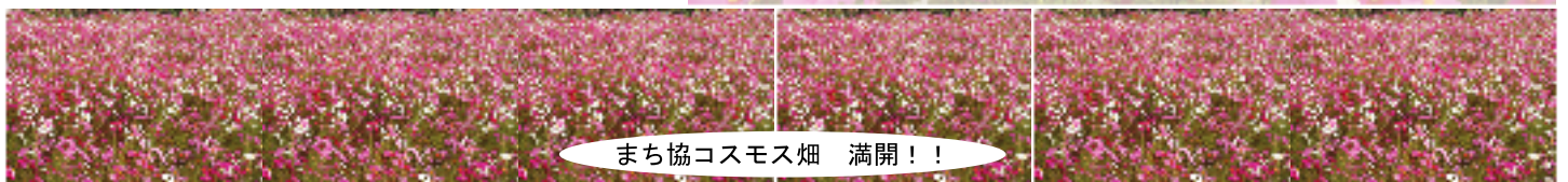
まち協コスモス畑 満開!!

まち協が管理しています日吉町の田んぼのコスモスが、秋が深まった10月中頃から競い合うように咲き始め、撮影した20日頃には、満開になりました。ピンク・赤・白の花々が約五反の田んぼに咲き誇り、見事な花の絨毯となりました。