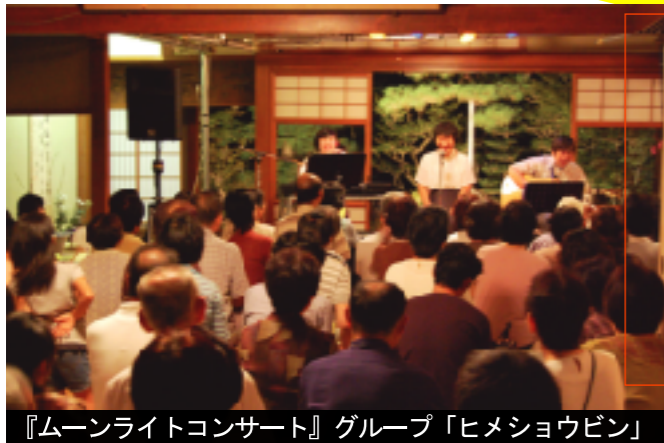
『ムーンライトコンサート』グループ「ヒメショウビン」