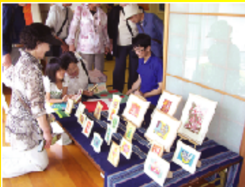
ぶらりまちかど美術館・博物館