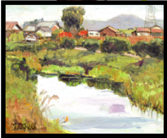
大同川のほとり〜三俣を望む〜

湖国の風景や長浜市の富田人形などを題材にし、これからも自分の好きな絵を気ままに描き続けたいと語られています。