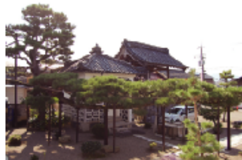
④行願寺の黒松 17メートルの見事な枝ぶりで、県下指折りの名松です。