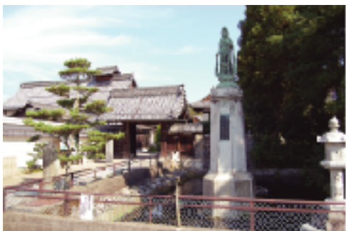
⑧齢仙寺 門前の池水は霊泉として有名