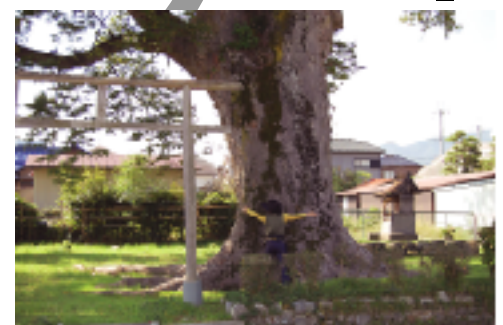
⑩へその宮さん ケヤキの大木