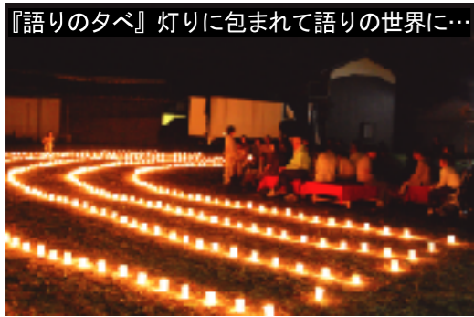
『語りのタベ』 灯りに包まれて語りの世界に…