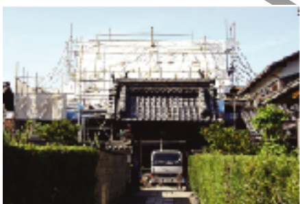
⑦西照寺 現在屋根の改修中