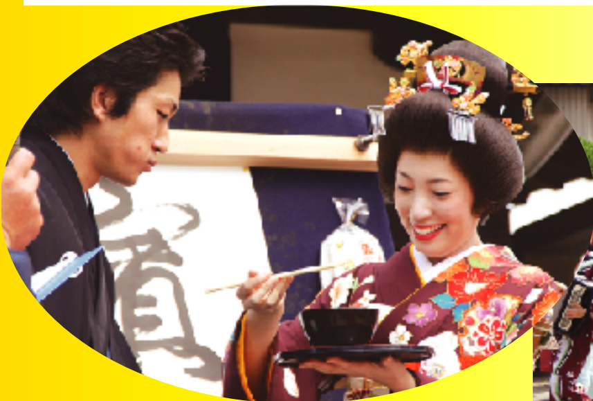
ごかのしょう新近江商人塾