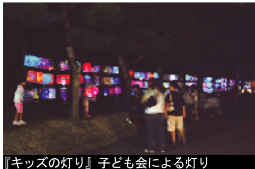
『キッズの灯り』 子ども会による灯り

毎年、秋のお彼岸の時期、恒例となった『近江商人：街並み灯り路』ですが、今年は9月22日23日に開催しました。22日は、秋の夜長、夕食後に灯りを愉しむ家族連れなどで賑わいました。23日は『ぶらっと五個荘まちあるき』で五個荘の町は遠方からのお客様で大賑わいでしたが、日中の喧騒から一転して、夕暮れからは近江商人の街並みや水辺が行灯の淡い光で静かに照らし出されました。訪れてくださった方々は、昼間と違った風情を味わっていただけたのではないのでしょうか。