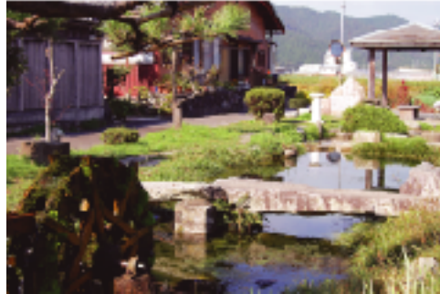
②ハリヨの里あれち 地域で守り育てています