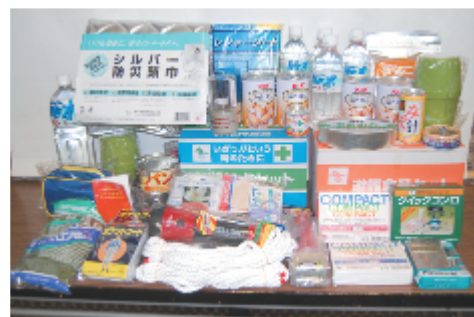
防災グッズ 家庭での備えはできていますか？