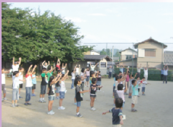
夏休みも早起きです ||ラジオ体操|| (北町屋)