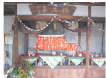
石川のお地藏様（石川町）地藏堂内の石仏

まつわるお話が『五個荘 むかし ばなし第一集』に載っています。石川が泉川と言われていた由来でもあります。巡礼の母子の男の子が地藏と化した場所から泉が湧き出、菩提をとむらうため地藏堂を建てられました