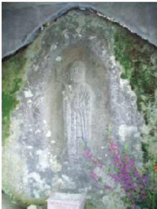
米かし地藏様（伊野部町） 地藏磨崖仏

錫杖が短いのは近江の特徴です。まつわるお話が『五個荘むかし ばなし第一集』に載っています。見知らぬ娘の身代わりに殺された、米をかしていた女性の右肩から斬り付けた状態が残されています。