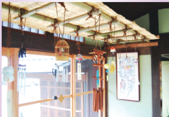
風鈴の音色が涼風を誘います (金堂まちなみ交流館)