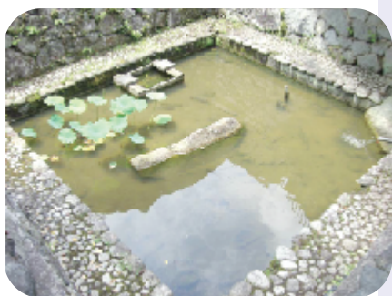
馬が石になった伝説の池