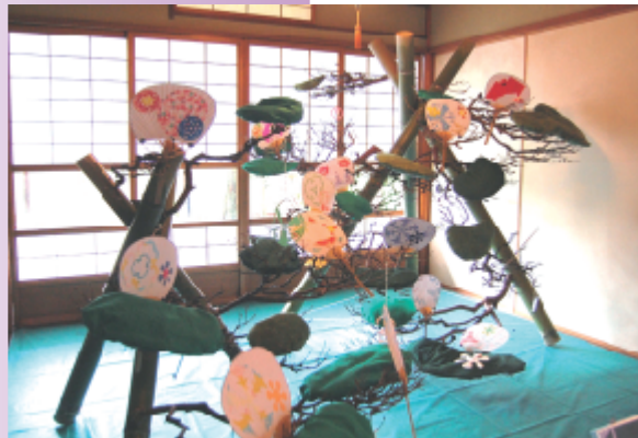
今も昔も夏のアイテム うちわ (近江商人屋敷)