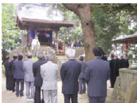
雨宮龍神社の明神祭り