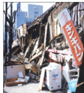
平成7年 阪神・淡路大震災倒壊現場