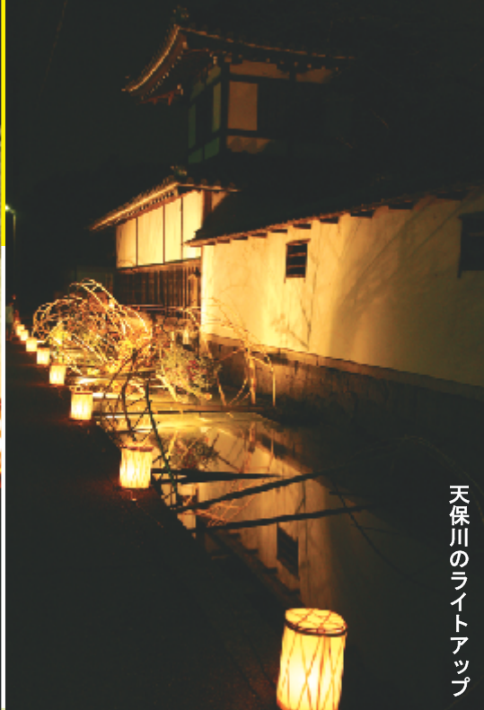
天保川のライトアップ