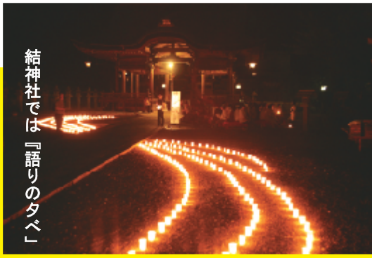
結神社では「語りのタベ」