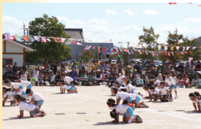
スポーツの秋 さくらんぼ幼稚園運動会