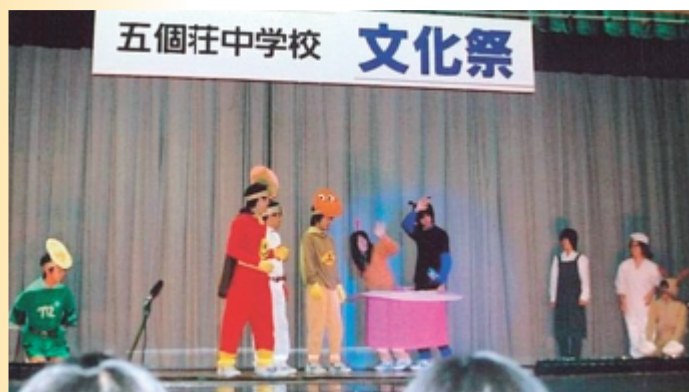
芸術の秋 中学校文化祭