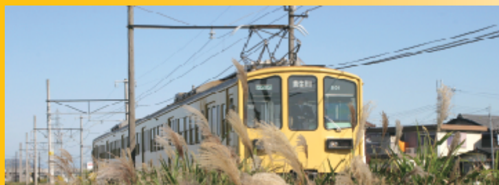
ススキの中を快走