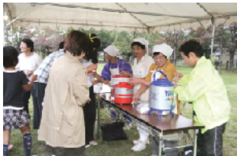
生活改善グループによる黒豆茶のサービス