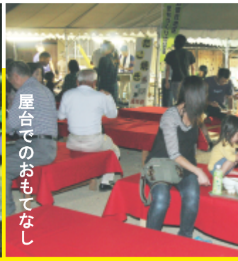
屋台でのおもてなし