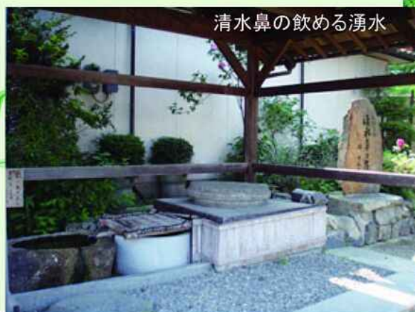
清水鼻の飲める湧水

所、道路わ きに井戸と 水飲み場が 近年整備さ れました。 井戸からは、 今も数軒が