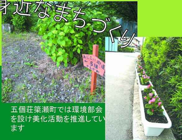
五個荘築瀬町では環境部会を設け美化活動を推進しています