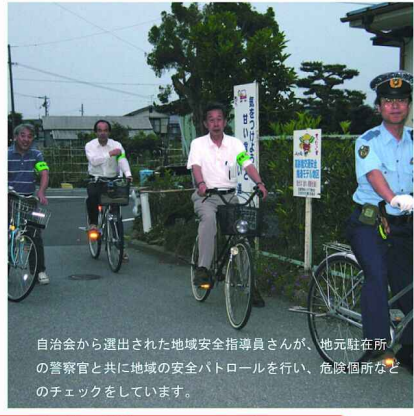
自治会から選出された地域安全指導員さんが、地元駐在所の警察官と共に地域の安全パトロールを行い、危険箇所などのチェックをしています。