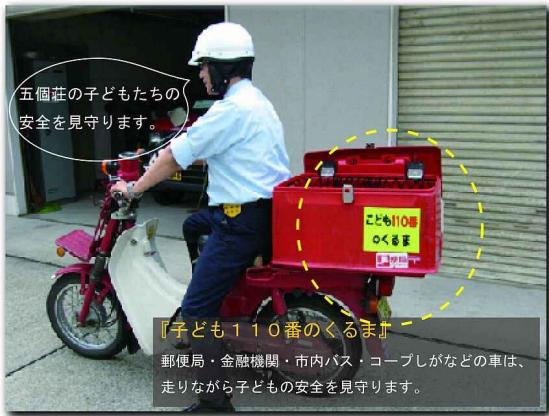
五個荘の子どもの安全を見守ります。