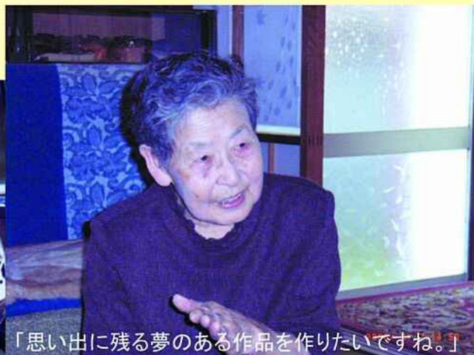
「思い出に残る夢のある作品を作りたいですね。」

現在は、地元で人形の着物づくりを教えておられま す。「いい先生いい友達に出会えたおかげで人形作り を続けてこられました」とおっしゃっています。これか ら思い出に残る夢のある作品を作られ、ますますお 元気でられることをご祈念いたします。