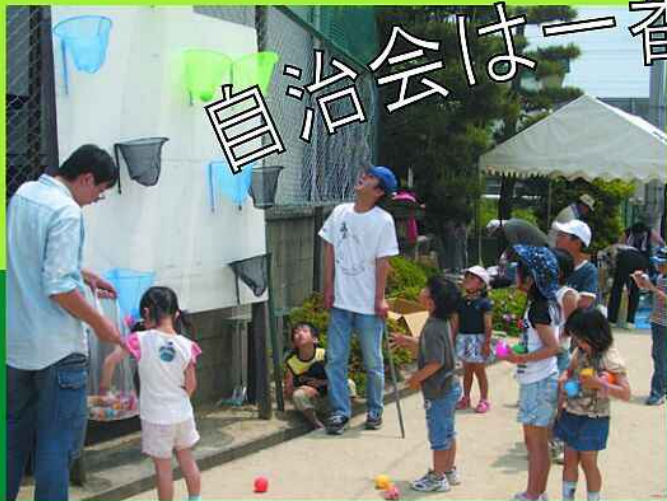
親子で楽しく参加(五個荘北町屋町 町民カーニバル)