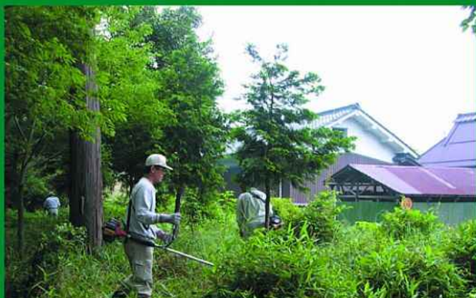
地域で協力し合って環境整備を行います