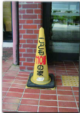
『子ども110番の家』設置