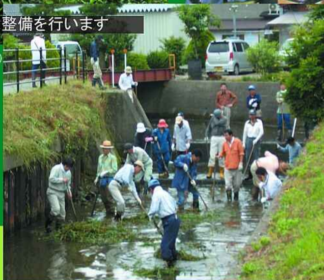
(五個荘七里町 河川清掃)