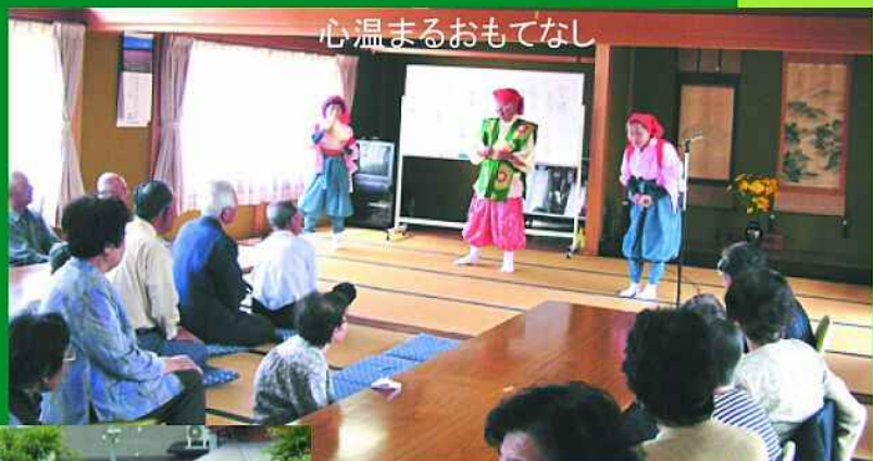
心温まるおもてなし