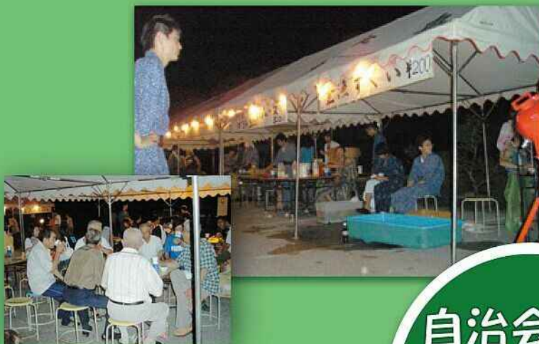
祇園祭りで交流を (五個荘奥町)