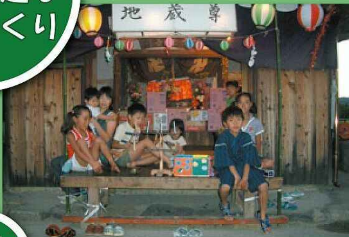
子どもたちが主役 地藏盆 (五個荘石川町)