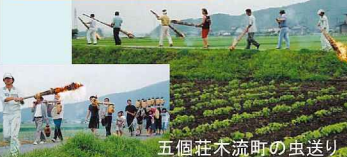
五個荘木流町の虫送り

今年も土用三郎に近い日曜日7月23日小雨の中、木流で守り継がれている恒例の『虫送り』が行われました。