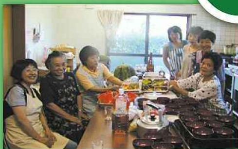
手作りふれあいサロン