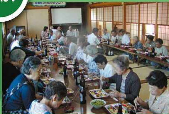
心のこもったお弁当に舌鼓 (五個荘石馬寺町)