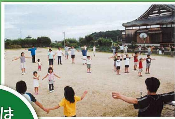
親子で参加 区民ラジオ体操(五個荘河曲町)