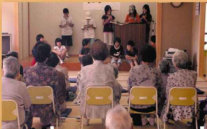
元気で長生きしてね。敬老会(五個荘中町)