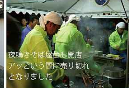
夜鳴きそば屋台も開店 アツという間に売り切れとなりました