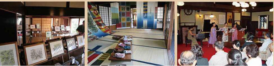
藤井邸ではクラシックピアノコンサートが開催され人気を集めました