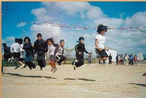
大空へジャンプ! 区民運動会 (五個荘新堂町)