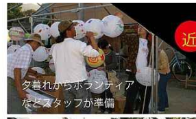
夕暮れからボランティアなどスタッフが準備