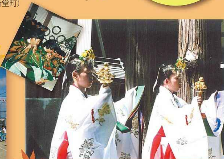
浦安の舞で雅に 秋祭り(五個荘金堂町)