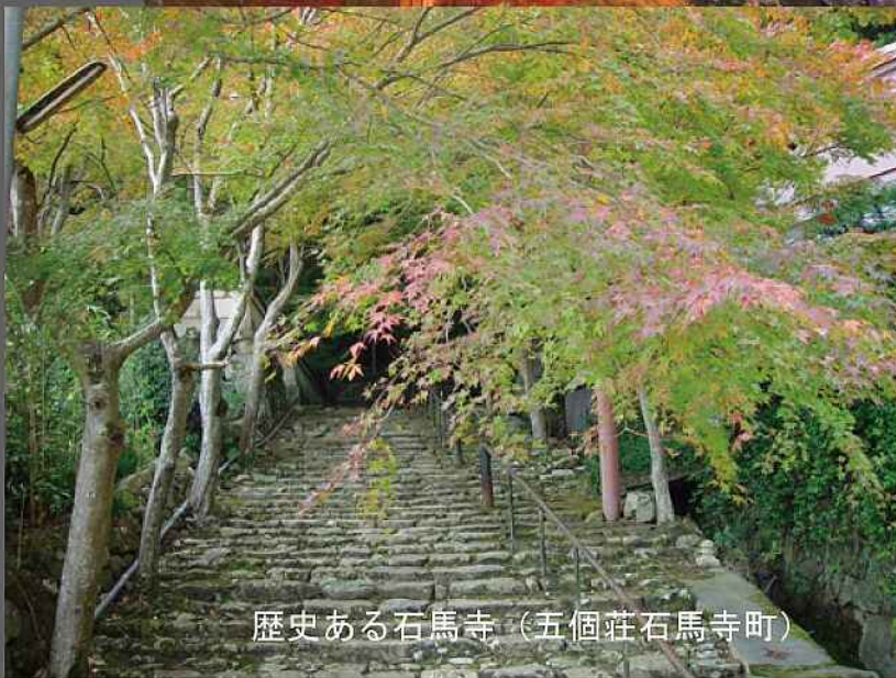
歴史ある石馬寺（五個荘石馬寺町）