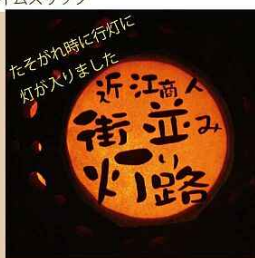
たそがれ時に行灯に灯が入りました