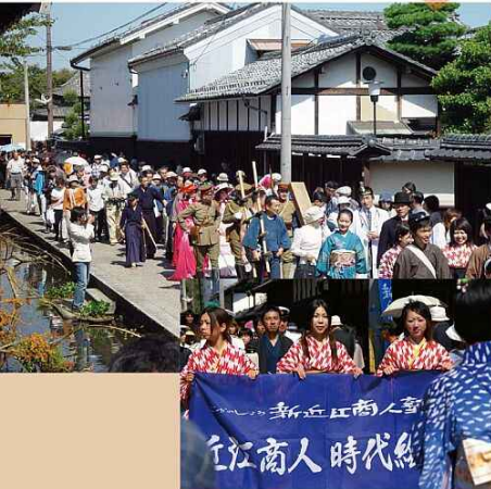
新近江商人塾 近江商人時代館

9月23日絶好の秋晴れの中、全国から大勢のお客さんを迎え、「ぶらりまちかど美術館・博物館」「ごかのしょう新近江商人塾」が開催されました。また、夕暮れからは、五個荘地区まちづくり協議会により「近江商人・街並み灯り路」が開催され、多くの皆さんが、灯りが演出する幻想的な秋の宵を楽しみました。