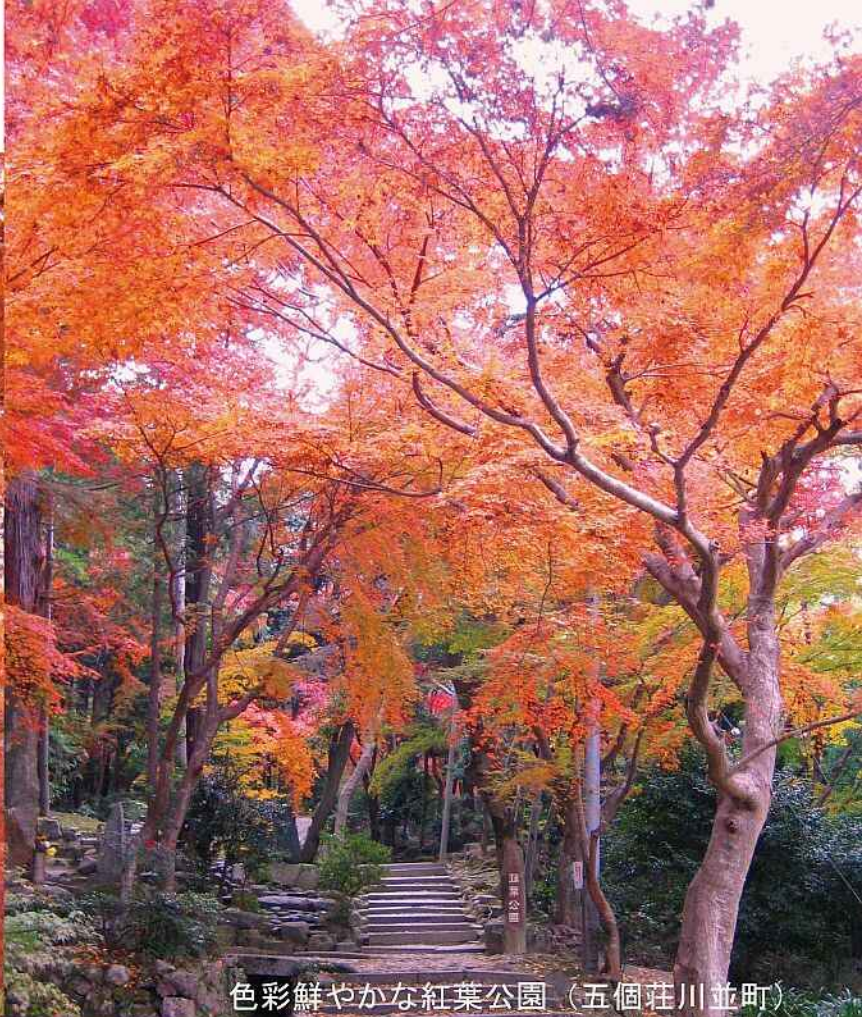
色彩鮮やかな紅葉公園（五個荘川並町）