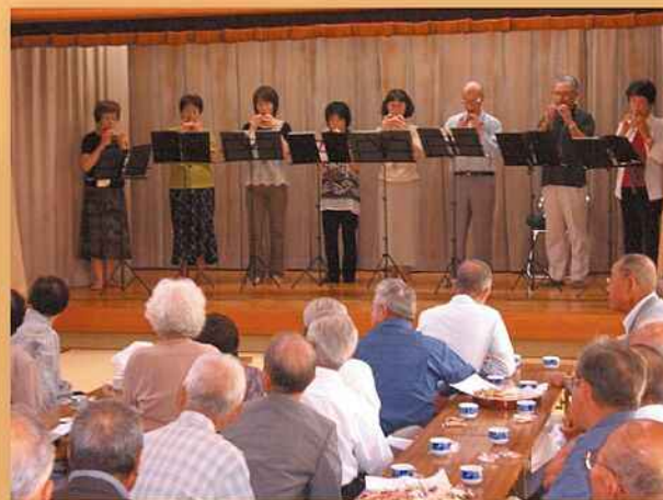
快いコカリナの音で長寿を祝う (宮荘町)