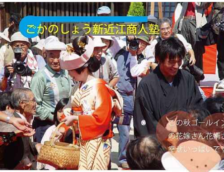
ごかのしょう新近江商人塾