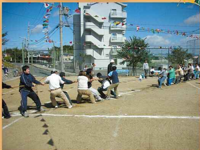
どちらもまけるな 区民健康スポーツ大会(五個荘清水鼻町)