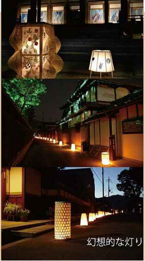
幻想的な灯りに浮かぶ街並み