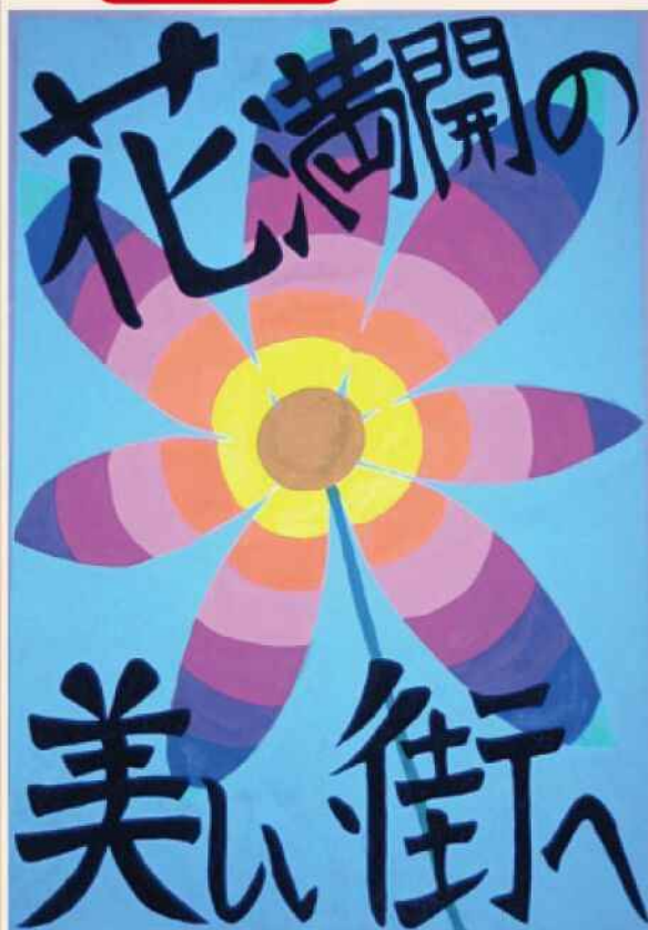
前川明日香さんの作品