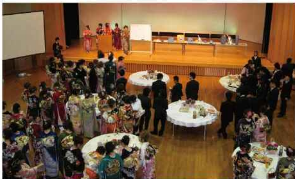
第二部 二十歳の集い