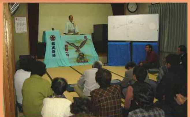
音頭に合わせて人権学習会 (五個荘和田町)