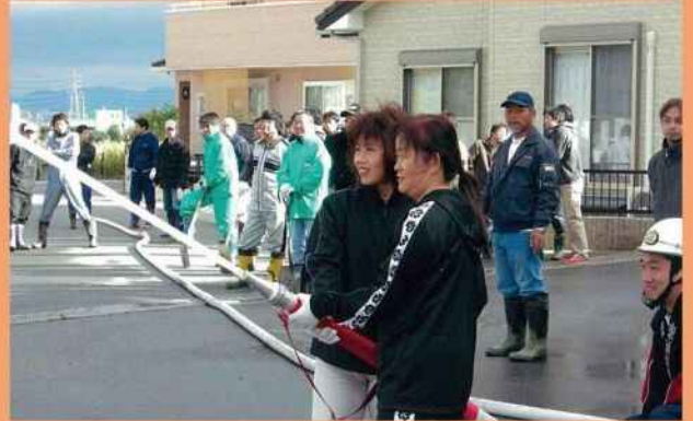
地域を火災から守ろう 防火訓練 (貴船自治会)