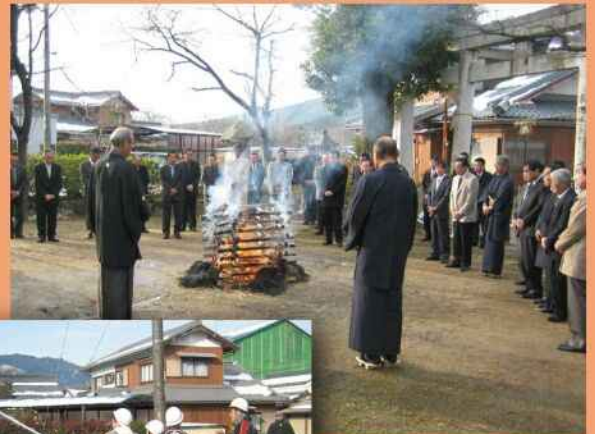
1月1日に行われた 拝賀式と出初式 (五個荘木流町)