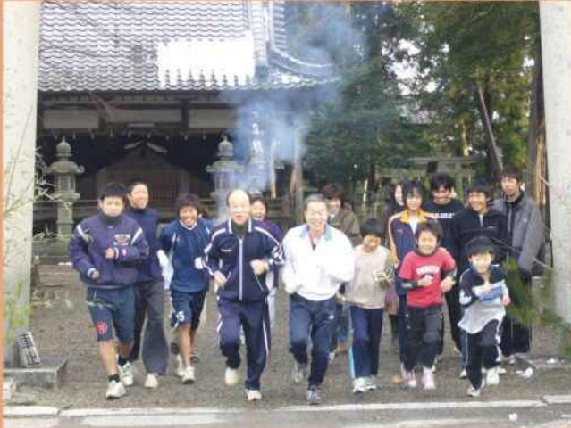
元旦マラソン (五個荘山本町)