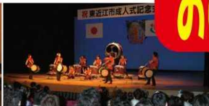
第一部 オープニング