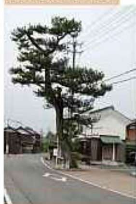
⑧街道の松 昔は松並木の街道だったのでしょ うか。今に残る数少ない松です。