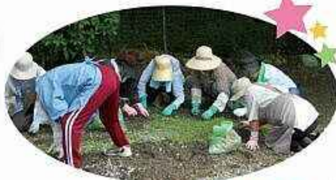
五個荘赤十字奉仕団 老人ホームでの清掃ボランティア