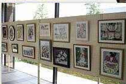
押し花サークル『おしぼな展』