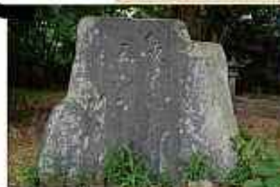
②芭蕉句碑 厳島神社（小幡町）には『八九間 そ らに雨ふる 隊かな』の句碑が、この 道を、芭蕉も歩いたのでしょ うか。