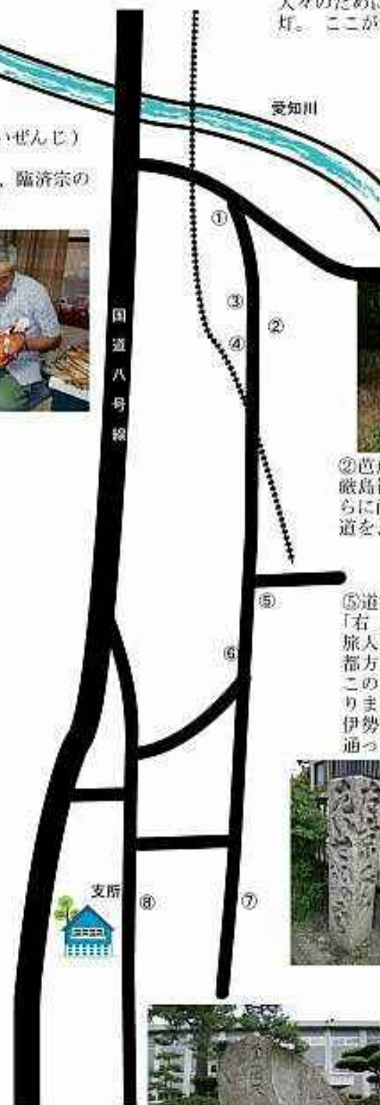
①常夜燈 愛知川を渡る人々の安全を守り、往来する 人々のために、道を照らした中出町の常夜 灯。ここが、中山道の北側の入口です。