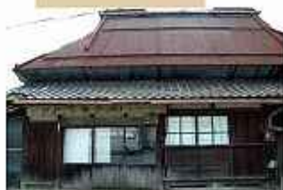
⑥街道はそこに住む人にとって重要な商 いの道でもありました。