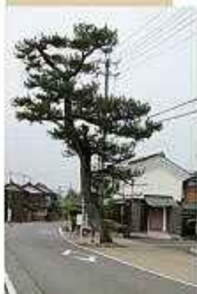
⑧街道の松 昔は松並木の街道だったのでしょうか。 今に残る数少ない松です。