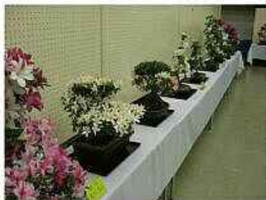
盆栽愛好会『さつき展』