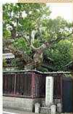
③東嶺禅師（とうれいぜんじ） 誕生の石碑 1719年当地に生まれ、臨済宗の 興隆に尽くしました。

古代から東西をつなぐ交通の要衝であった近江。その中で当地五個荘は、五街道の一つである中山道が、南北にまちを貫いています。また中山道小幡は、東海道へのバイパスであった御代参街道（ごだいさんかいどう）の結節点でもあります。歴史的に重要な街道 中山道を、気ままに歩いてみました。