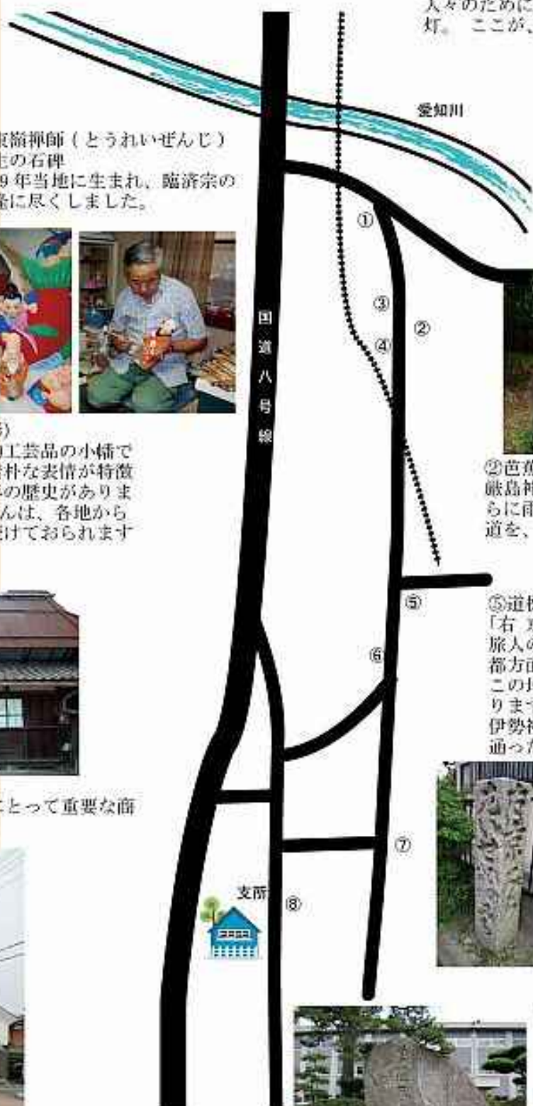
①常夜燈 愛知川を渡る人々の安全を守り、往来する 人々のために、道を照らした中田町の常夜 灯。ここが、中山道の北側の入口です