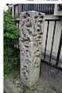
いま風にいえば、伊勢道バ イパス小幡ジャンクション といった感じでしょうか。