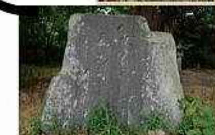
②芭蕉句碑 畷島神社（小幡町）には『八九間 そ らに雨ふる 柳かな』の句碑が。この 道を、芭蕉も歩いたのでしょうか。