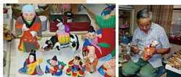
①小幡でこ（小幡人形） 中山道で育まれた伝統的工芸品の小幡 でこは、鮮やかな色彩と素朴な表情が特徴 の土人形で、約300年の歴史がありま す。9代目 細居源悟さんは、各地から の注文に応じ、製作を続けておられます