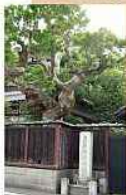
③東嶺禪師（とうれいぜんじ） 誕生の石碑 1719年当地に生まれ、臨済宗の 興隆に尽くしました。

古代から東西をつなぐ交通の要衝であった近江。その中で当地五個荘は、五街道の一つである中山道が、南北にまちを貫いています。また中山道小幡は、東海道へのバイパスであった御代参街道（ごだいさんかいどう）の結節点でもあります。歴史的に重要な街道 中山道を、気ままに歩いてみました。