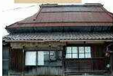
⑥街道はそこに住む人にとって重要な商 いの道でもありました。