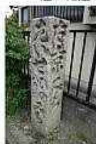
いま風にいえば、伊勢道バ イパス小幡ジャンクション といった感じでしょうか。