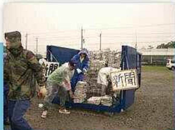
保育園・幼稚園PTA 梅雨空のなか、リサイクル資源回収を実施