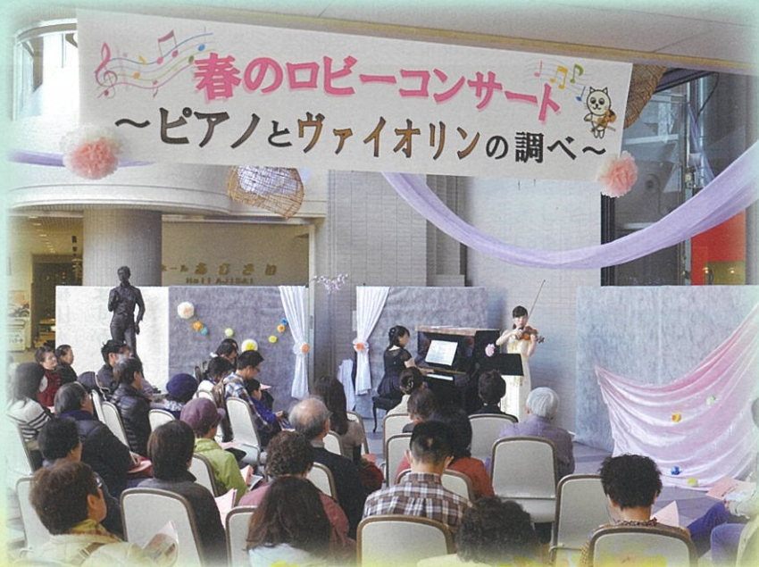
上：貝合わせとお茶会 下：ロビーコンサート