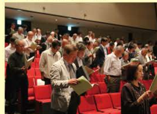
▼テーマソング「六つの心」を合唱