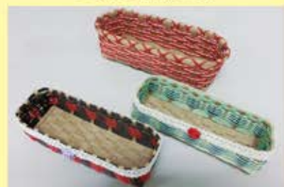
▲クラフトテープを使った小物入れ