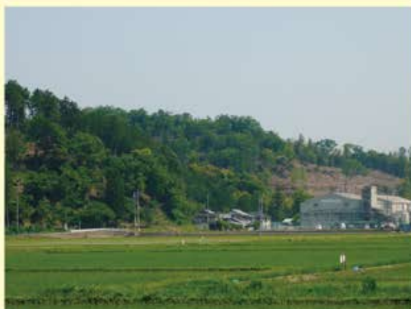
▲竹林の除去や雑木の間伐が行われている日吉町の里山

多くの地域で緑いっぱいの里山が後世まで美しい姿を保ち続けることを期待したいですね。