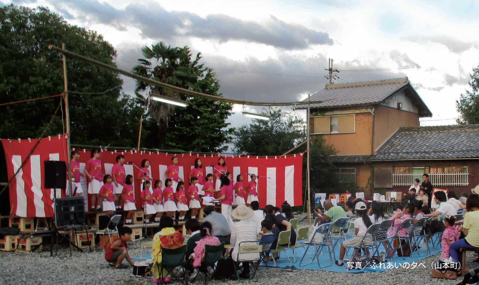
写真 ふれあいの夕べ (山本町)